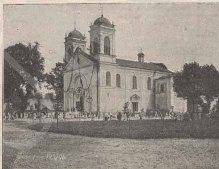
Kościół w Józefowie Ordynackim.