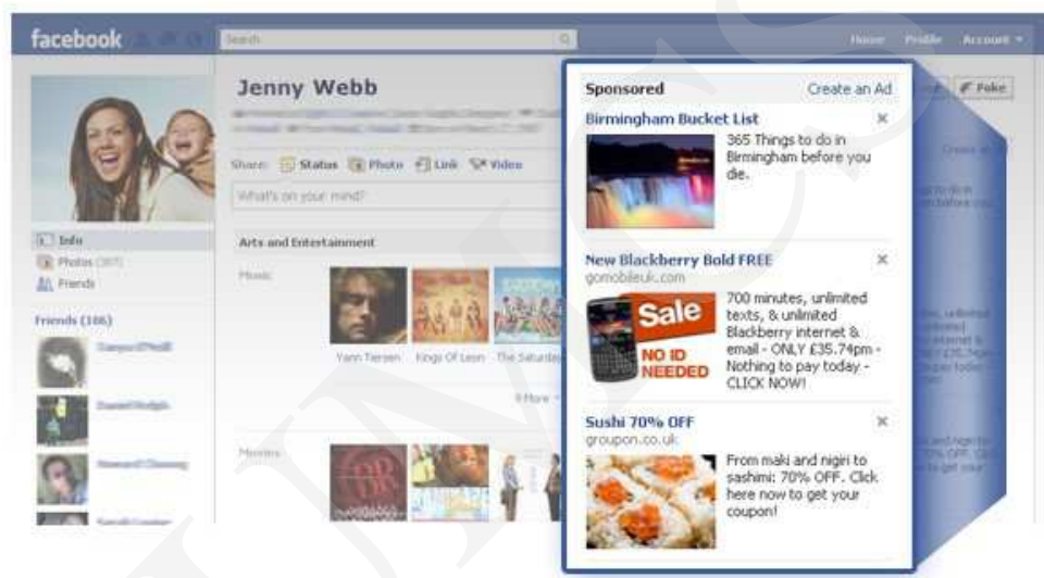
Ryc. 4. Facebook – reklama

lubi bądź obserwuje. Użytkownik ma przeświadczenie, że pokazuje znajomym, co lubi, a tak naprawdę dopuszcza do siebie kolejnych reklamodawców. Co gorsza, przeglądając strumień danych na Facebooku, użytkownik nie zauważa, że wśród informacji z profili znajomych znajdują się także ukryte reklamy 10 .