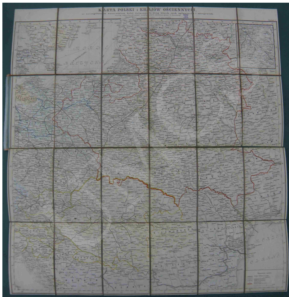
Fot. 5. Karta Polski i krajów ościennych, ze szczegółowym oznaczeniem kolei żelaznych, dróg bitych, rzek splawnych i zdrojowisk, według najnowszych podań statystycznych, skreślona przez J. Osieckiego

delikatnej szrafury (rodzaj cieniowania graficznego). Miasta sklasyfikowano według funkcji administracyjnej, trakty pocztowe podzielono na trakty główne, wśród których wyróżniono drogi bite i zwyczajne. Wszystkie te elementy przedstawiono różnymi rodzajami linii podwójnej. J. Engloff zamieścił na mapie też drogi bite projektowane i w budowie oraz inne drogi zwyczajne o mniejszym znaczeniu. Linie kolejowe wyrysowano za pomocą pogrubianej linii ciągłej z poprzecznymi kreskami i uzupełniono oznaczeniem stacji kolejowych z rozróżnieniem trzech klas