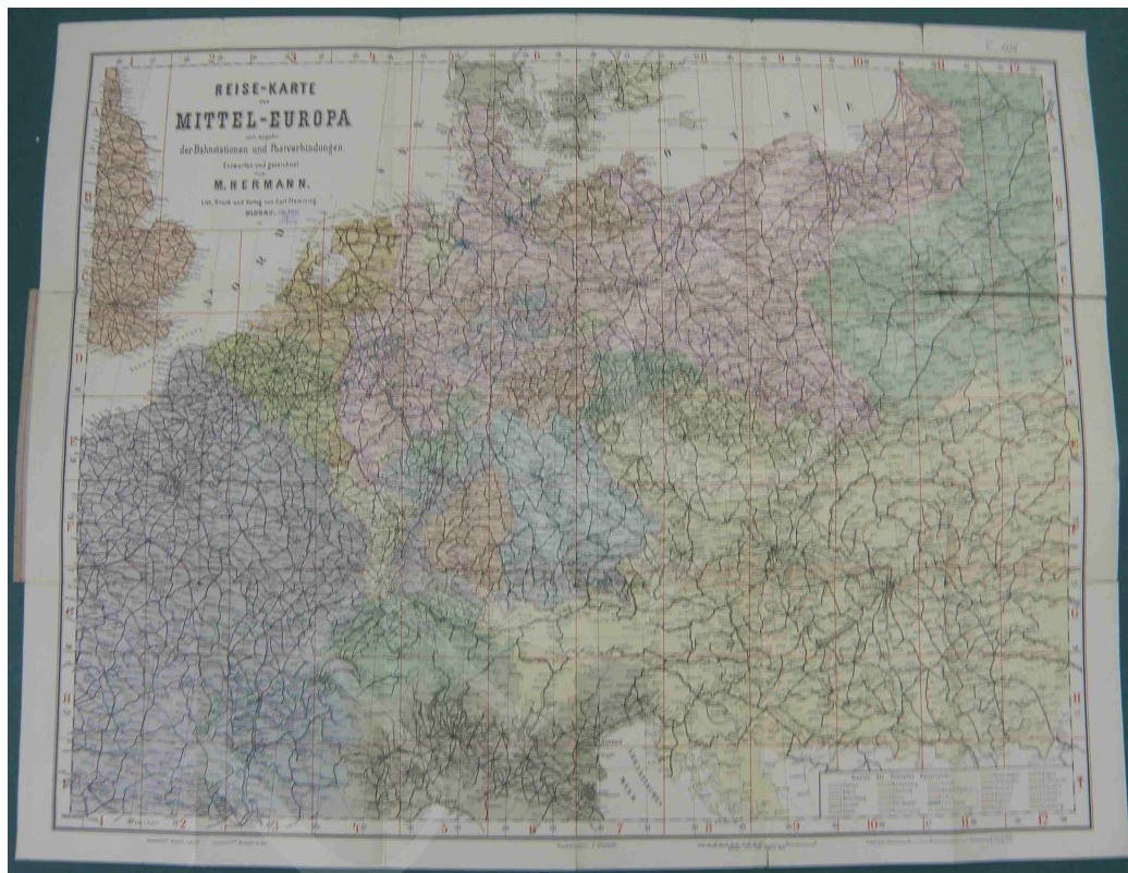
Fot. 13. Reise-karte von Mittel-Europa mit Angabe der Bahnhöfen und Postverbindungen entworfen und gezeichnet von M. Hermann

Fotografia 13 przedstawia 25. wydanie mapy komunikacyjnej w kolorze M. Hermanna. Zaznaczono na niej południk zerowy Ferro oraz naniesiono siatkę skorowidzową. Została wydana w miękkiej okładce, na której widnieje tytuł: Reisekarte von Mittel-Europa... , i umieszczona w ramce. W prawym dolnym rogu znajduje się legenda, a pod mapą 2 podziękowania 20 .