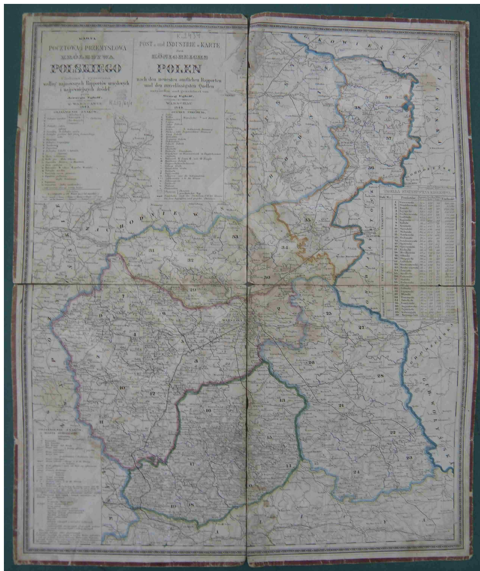
Fot. 11. Karta pocztowa i przemysłowa Królestwa Polskiego. Ułożona i rysowana według najnowszych raportów urzędowych i najpewniejszych źródeł przez Jerzego Engloffa