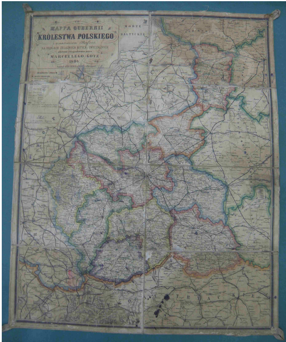
Fot. 3. Mapa Gubernii Królestwa Polskiego z oznaczeniem odległości na drogach żelaznych, bitych i zwyczajnych, ułożona i litografowana przez Marcelego Gotza