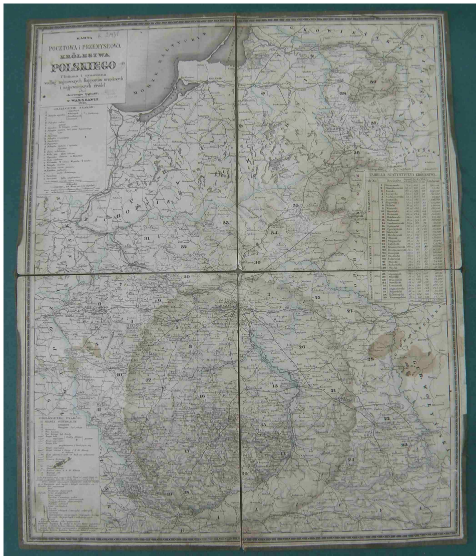
Fot. 7. Karta pocztowa i przemysłowa Królestwa Polskiego, ułożona i rysowana według najnowszych raportów urzędowych i najpewniejszych źródeł przez Jerzego Engloffa

ważności. Elementy komunikacji wodnej zostały oznaczone sygnaturą obrazkową kanałów i rzek spławnych, natomiast urzędy i stacje pocztowe – sygnaturą symboliczną – trąbką pocztyliona. Komory celne podzielono na 3 klasy. Odległości przy traktach pocztowych w granicach Królestwa Polskiego podano w wiorstach, a poza jego granicami w milach, głównie przy ważniejszych traktach pocztowych.