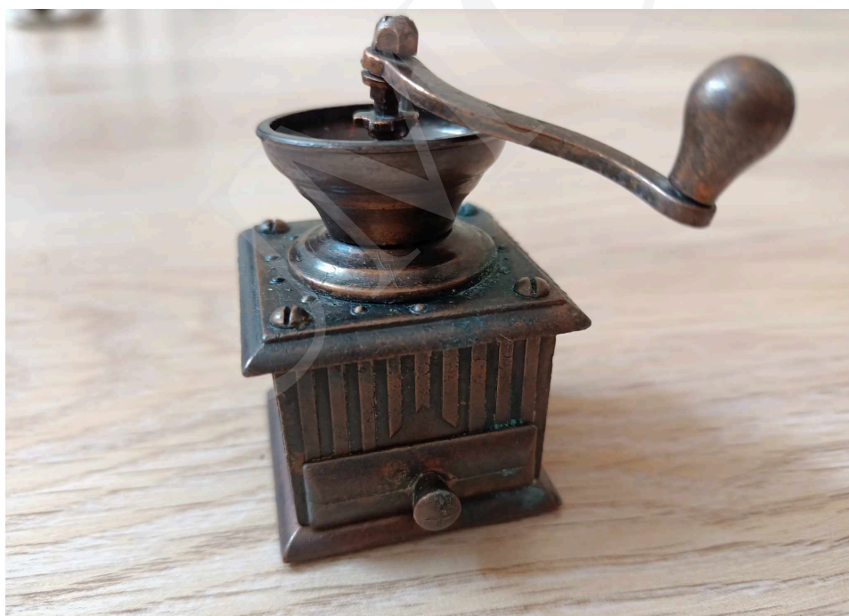
Fot. 1. Wystawa „Malańkie cudenka – niezwykła pasja kolekcjonera temperówek” w holu Biblioteki Głównej UMCS w Lublinie.

Właścicielką przedstawionych eksponatów oraz prezentowanych zdjęć jest pani Alicja Juszcak, nauczycielka na co dzień pracująca w Prywatnej Szkole Podstawowej im. Królowej Jadwigi w Lublinie. Od 18 lat kolekcjonuje temperówki, które mają kształty różnych przedmiotów codziennego użytku: miniatur militariów, instrumentów muzycznych, pojazdów czy budynków. Co ciekawe, każdy z tych przedmiotów posiada ruchome elementy: otwierane szuflady i drzwiczki czy pokrętła i korbki. Przepiękne unikatowe temperówki o doskonale odwzorowanych detalach wykonano z niezwykłą precyzją szczegółów. Obecnie kolekcja liczy 187 sztuk i nadal jest powiększana. Głównie są to pamiątki przywożone z podróży po różnych krajach.