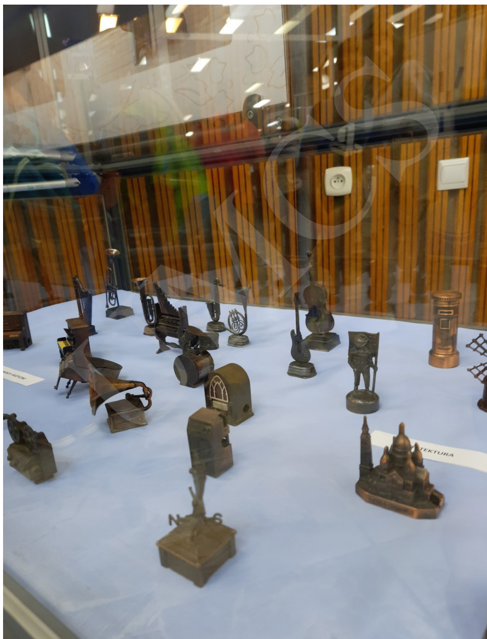
Fot. 6. Wystawa „Małeńkie cudzeńka – niezwykła pasja kolekcjonera temperówek” w holu Biblioteki Głównej UMCS w Lublinie.