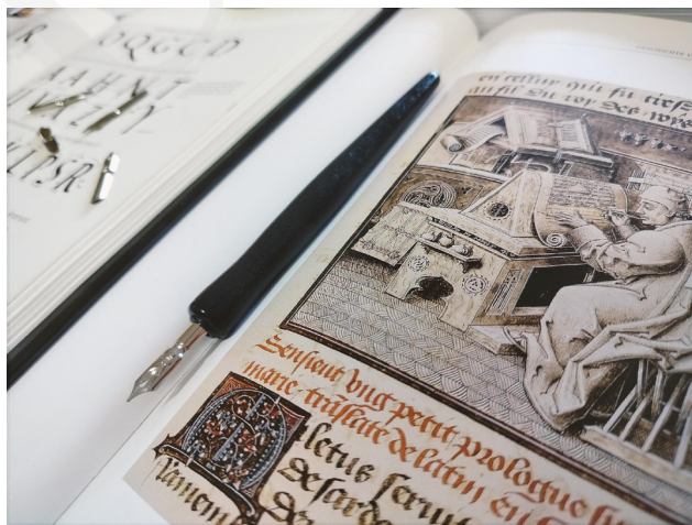
Fot. 1. Przykłady iluminacji i tradycyjnych materiałów piśmienniczych, fot. A. Mikulska.

W dniach 18–24 września 2023 roku Uniwersytet Marii Curie-Skłodowskiej w Lublinie aktywnie włączył się w organizację Lubelskiego Festiwalu Nauki. Dziewiętnasta edycja wydarzenia osiągnęła rekordowe wyniki pod względem zgłoszonych projektów – aż 1758 wydarzeń, prezentacji i warsztatów. Zgromadziła