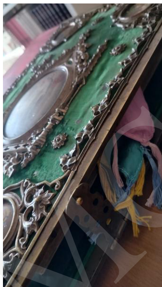
Fot. 4. Biblia w kunsztownie wykonanej oprawie, fot. A. Mikulska.

Duże wrażenie wywarła prezentacja najstarszych zasobów bibliotecznych, sięgających początków rozwoju druku, jak Biblia w przekładzie Marcina Lutera z 1686 roku o objętości około 4 tysięcy stron i wadze kilku kilogramów. Imponujące księgi oprawne w okładki wykonane z desek pokrytych tłoczoną skórą czy aksamitnym sukniem i opatrzonych dekoracyjnymi okuciami zaintrygowały odwiedzających, zapraszając do refleksji nad wartością oraz rozwojem książki w aspekcie historycznym i kulturalnym.