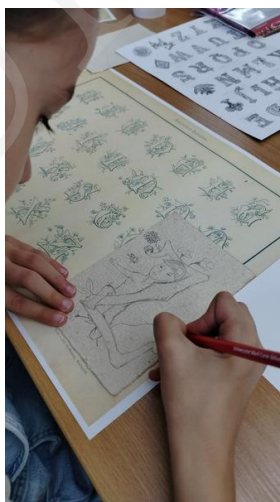
Fot. 9. Precyzyjne szkicowanie projektu, fot. A. Mikulska.

Warsztaty cieszyły się dużym zainteresowaniem, a uczniowie we wszystkich grupach wiekowych wykazali się zaangażowaniem podczas realizacji zadań, korzystając z wiedzy uzyskanej podczas części wprowadzającej. Młodszy uczestnicy pomimo wyższego stopnia trudności związanego z początkami nauki pisania wyróżniali się dużą kreatywnością. Praca dzieci przebiegała dwutorowo – część uczniów skoncentrowała się na pierwszym etapie projektowania inicjału i tworzeniu szkicu, starając się zagospodarować całą powierzchnię kartki i wielokrotnie nanosząc poprawki. Wśród pozostałych „iluminatorów” w akcie twórczym dominowała spontaniczność i odważna ekspresja przy zastosowaniu łączonych materiałów, jak farby, brokat, elementy dekoracyjne. We wszystkich grupach wiekowych ważnym czynnikiem okazało się wskazywanie etapów pracy oraz określanie ram czasowych dla poszczególnych części zadania. Pomocą metodyczną dla prowadzących stanowił plan pracy w formie opracowanego autorskiego scenariusza zajęć, jako punkt odniesienia pomocny przy moderowaniu działań uczniów. Przewidywany czas zajęć wynosił 60 minut, co wymuszało intensywne tempo pracy, wydawało się jednak optymalne z uwagi na możliwości utrzymania uwagi całej grupy.