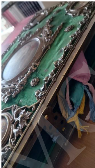
Fot. 4. Biblia w kunsztownie wykonanej oprawie, fot. A. Mikulska.

Duże wrażenie wywarła prezentacja najstarszych zasobów bibliotecznych, sięgających początków rozwoju druku, jak Biblia w przekładzie Marcina Lutera z 1686 roku o objętości około 4 tysięcy stron i wadze kilku kilogramów. Imponujące księgi oprawne w okładki wykonane z desek pokrytych tłoczoną skórą czy aksamitnym sukniem i opatrzonych dekoracyjnymi okuciami zaintrygowały odwiedzających, zapraszając do refleksji nad wartością oraz rozwojem książki w aspekcie historycznym i kulturalnym.