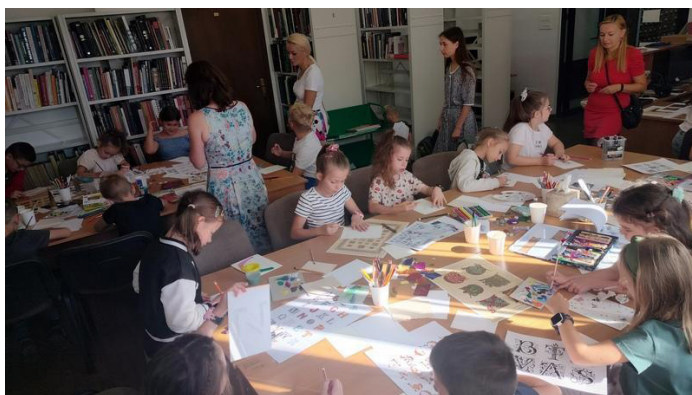
Fot. 8. Uczniowie podczas pracy warsztatowej – projektowanie iluminowanego inicjału