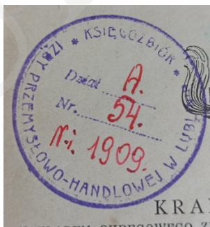
Ryc. 10. Pieczęta Biblioteki Izby Przemysłowo-Handlowej w Lublinie.

Leopold Méyet to polski teoretyk prawa, adwokat i literat, a także bibliofil i filantrop 35 . Urodził się w Warszawie w 1850 r. w zamożnej, kupieckiej rodzinie żydowskiej. Był jednym z największych kolekcjonerów rozmaitych pamiątek, dzieł sztuki, stylowych mebli, bibelotów i zegarów. Szczególnie upodobał sobie okres romantyzmu, gromadził dzieła sztuki po narodowych wieszczach. Był posiadaczem ogromnego zbioru książek i starodruków, zbioru 450 ekslibrisów, a także unikalnego zbioru autografów i fotografii wszystkich pisarzy polskich z ostatnich dziesięciu lat XIX stulecia 36 oraz cennej kolekcji starych fotografii. Część swoich zbiorów oraz 1,5 tysiąca rubli przekazał testamentem w 1911 r. Muzeum Miejskiemu w Warszawie, skąd później trafiły do Muzeum Narodowego, a w 1955 r. zostały przekazane do Muzeum Literatury; część ksiąg przekazał warszawskiej bibliotece Towarzystwa Prawniczego, Warszawskiemu Towarzystwu Muzycznemu; wiele rękopisów, fotografii i książek – Bibliotece Ordynacji Krasińskich; niektóre eksponaty darował Muzeum Adama Mickiewicza przy Bibliotece Polskiej w Paryżu 37 . Zmarł w 1912 r. w Warszawie.