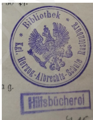
Ryc. 11. Pieczęć Biblioteki Gimnazjum w Rastenburgu.

Izba Przemysłowo-Handlowa w Lublinie powstała w marcu 1929 r. 38 W pracach nad jej założeniem brali udział polscy i żydowscy właściciele największych przedsiębiorstw handlowych, przedstawiciele kupiectwa lubelskiego i wołyńskiego, osoby reprezentujące banki i największe zakłady przemysłowe, a także znani działacze społeczni, radni miasta i politycy. Z jej inicjatywy została utworzona w 1931 r. Giełda Zbożowo-Towarowa w Lublinie 39 oraz jej filia w Równem na Wołyniu. Izba Przemysłowo-Handlowa w Lublinie posiadała bibliotekę 40 . Na mocy zarządzenia przewodniczącego Państwowej Komisji Planowania Gospodarczego w 1950 r. zakończyła działalność. Likwidacja jej spowodowała, że obszerny księgozbiór, liczący 5,5 tys. tomów, wraz z czasopismami, został przekazany do Zakładu Ekonomii Politycznej Katedry Ekonomii Wydziału Prawa i międzywydziałowego Instytutu Nauk Ekonomicznych UMCS. „Dzięki temu UMCS zawdzięcza Izbie posiadanie nieocenionych sprawozdań wojewody wołyńskiego. [...] Praktycznie każdy tom opatrzony był interesującym exlibrisem, przedstawiającym patrona kupców – Merkurego (w uskrzydłonym kapeluszu) oraz kołem zębatym – symbolem przemysłu” 41 .