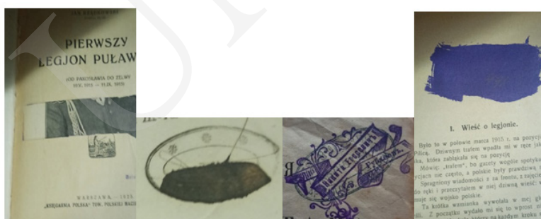
Ryc. 4. Przykłady dezaktualizacji pieczętek.

Odcisk tuszowy pieczętki można łatwo usunąć za pomocą odpowiednich odczynników chemicznych, w przeciwieństwie do odbitej farbą drukarską czy wykonanej przy użyciu suchego tłoku. Spotyka się też przypadki dewastacji pieczętek przez usunięcie fragmentu strony, na której się znajdowała, jej wycięcia czy zamazania ciemnym tuszem lub innym środkiem uniemożliwiającym odczytanie, a także nałożenie – odbicie nowej pieczętki na już istniejącą (ryc. 4).