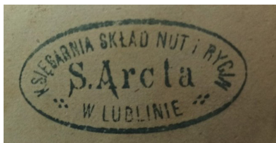
Ryc. 6. Pieczęćka firmy wydawniczo-księgarskiej Stanisława Arcta.

Waław Bajkowski był wybitnym polskim prawnikiem i społecznikiem, który pełnił funkcję prezydenta Lublina w latach 1916–1918 20 . Urodził się 31 grudnia 1875 r. we wsi Włostowice koło Puław. Po studiach prawniczych na Uniwersytecie Warszawskim w 1903 r. rozpoczął aplikację adwokacką w Lublinie, specjalizując się w prawie cywilnym. Oprócz pracy zawodowej angażował się również w działalność publiczną i samorządową, był jednym z organizatorów sądownictwa obywatelskiego w Lublinie. Na jego wniosek Rada Miejska z okazji 600-lecia nadania Lublinowi praw miejskich uchwaliła, by placowi przed Magistratem nadać imię króla Władysława Łokietka oraz zażądać zwrotu wywiezionych do Wilna najstarszych zasobów archiwalnych ziemi lubelskiej i Podlasia. W 1940 r. został zatrzymany przez Gestapo, wywieziony do obozów koncentracyjnych Sachsenhausen i Dachau, gdzie 11 kwietnia 1941 r. zginął. W uznaniu zasług Waława Bajkowskiego w 2009 r. ulica przy gmachu Ratusza (wcześniej ul. Przystankowa) została nazwana jego imieniem.