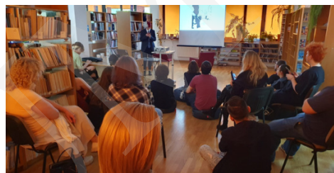
Fot. 4. Spotkania z mangą i anime.