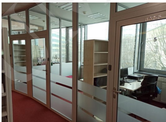
Fot. 1. Pokoje do pracy indywidualnej i grupowej – Biblioteka Uniwersytetu Przyrodniczego Lublin.

sale multimedialne, sale konferencyjne, laboratoria, centra dydaktyczne, kawiarnie czy miejsca relaksu. „Architektura biblioteczna [...], coraz częściej odchodzi od sztywnych podziałów na czytelnie, wypożyczalnię, ale stara się zapewnić przyjazne miejsce do pracy, nauki, odpoczynku, kontaktów społecznych” 13 . Budynki biblioteczne w swoich murach oferują ciekawe miejsca, w których warto przebywać 14 , gdzie można przyjść i miło spędzić czas. Osoba przychodząca do biblioteki nie musi być jej czytelnikiem i korzystać ze zbiorów, może wykorzystać specjalne przestrzenie do relaksu, spotkać się, porozmawiać ze znajomymi, napić się kawy. Użytkownikom biblioteka powinna kojarzyć się z miejscem przyjaznym, dającym poczucie bezpieczeństwa, zachęcającym do spotkań 15 . Współczesne biblioteki są wielofunkcyjne, oferują swoim czytelnikom miejsca nauki, edukacji, kultury, spotkań czy innych form działania 16 . Znajdują się tam strefy nauki, relaksu czy odpoczynku, gdzie można usiąść na pufie czy hamaku i cieszyć się książką. Dla najmłodszych są miejsca zabaw z kryjówkami do chowania się. Jeżeli potrzebujesz miejsca do spotkania ze znajomymi, do tego również jest biblioteka 17 .