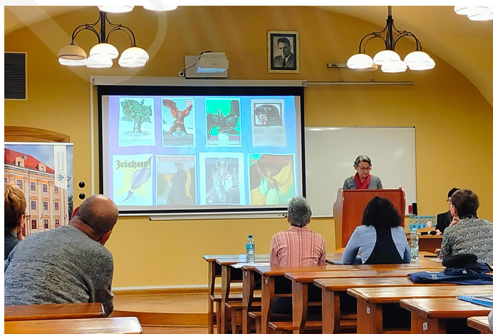
Fot. 2. Prezentacja jednego z wystąpień.