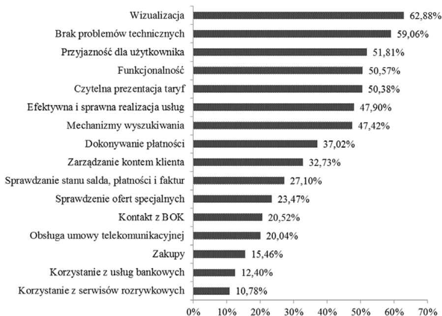
Rys. 2. Uśrednione oceny kryteriów jakości serwisów operatorów telekomunikacyjnych