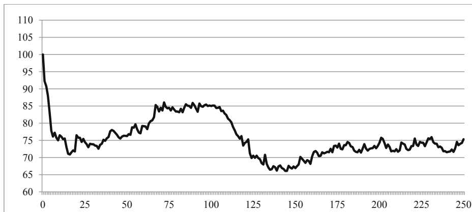
Rysunek 2. Średni kurs akcji po scaleniu

Pozostałe akcje o najniższych możliwych cenach notowały skokowe wahania o 1 grosz. Wśród nich cena FON-u i Elkopu oscylowała między 1 a 2 groszami, Sanwilu 4–5 groszami, a PC Guarda 2–4 groszami. Ponadto akcje Mewy przez cały okres przed scaleniem notowano po cenie 1 grosza (oferty podażowe po cenie 1 grosza nie były nawet zaspokojone).