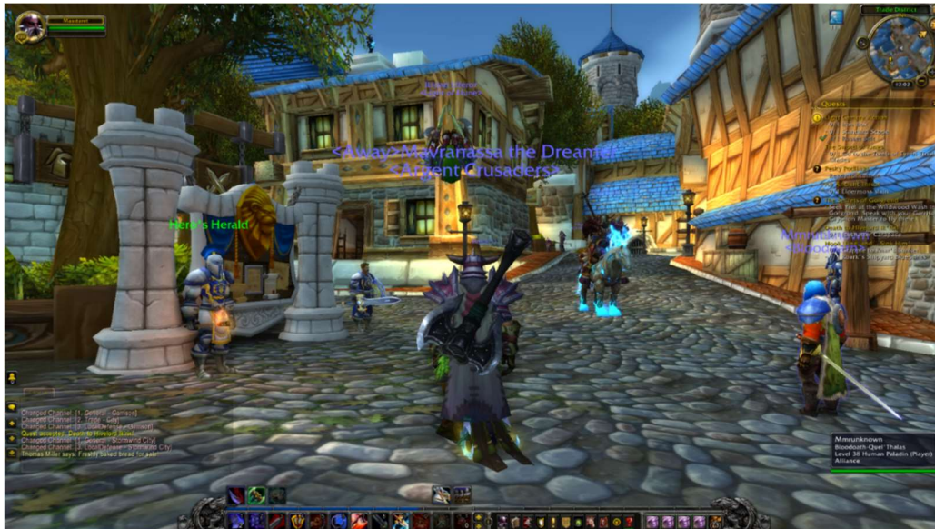
Stormwind, World of Warcraft

„zamieszkuje miasto”, jego konkretyzacją jest mieszkaniec, który porusza się w strukturze miejskiej, wystawiony na rozmaitego rodzaju oddziaływania.