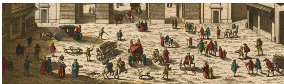
Ilustracja 10. Widok Paryża, brama Saint Martin, vue d'optique 31x45 cm, ok. 1760.

Kolejny efekt pozorowania przestrzenności grafiki przez zograscope związany jest z powszechną praktyką podkolorowywania vue d'optique , co nie jest zabiegiem czysto ornamentalnym. Powstaje dzięki temu efekt chromostereopsis – wrażenie głębi przestrzennej osiągnięte w dwuwymiarowych obrazach, na skutek zestawiania ze sobą kolorów odległych na skali „temperaturowej” barw 15 . Relatywne różnice temperatury barw przekładane są na wrażenie dystansu do oka obserwatora. Szczególnie aktywnie działają w tym kierunku skrajne zestawienia: czerwony – niebieski,