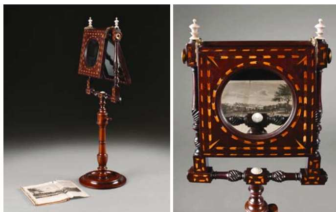
Ilustracje 1 i 2. Zograscope , model salonowy, Anglia, ok. 1770, obecnie w zbiorach Muzeum Pałac w Wilanowie.

Zograscope to zadziwiające urządzenie optyczne, stworzone do generowania „wirtualnych obrazów 3-D”. Wizualizują się one w okulusie zograscope . Nie można ich jednak sfotografować przestrzennie, w trójwymiarowej postaci bowiem istnieją tylko w postrzeżeniu widzów. Przy czym nie są to wizje o charakterze marzeń sennych, hipnozy czy halucynacji, bo natura ich pochodzenia jest techniczna. Źródłem inicjującym ich wywoływanie jest działanie optycznej maszyny zograscope .