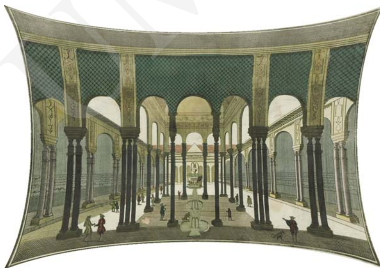
Ilustracja 6. Dziedziniec Lwów w pałacu Maurów w Grenadzie, grafika ok. 1760. Symulacja efektu zniekształcenia grafiki przez pozorne, żaglaste ugięcia jej powierzchni w optyce dwustronnie wypukłej soczewki (na podstawie reprodukcji).

W percepcji widza tworzy się wrażenie trójwymiarowego menisku wklęsłego. Centrum grafiki cofa się, krawędzie występują do przodu, naroża unoszą się pozornie ku widzowi. Daje to efekt wycinka hemisferycznej dioramy (zob. il. 6). Rezultat ten znacznie zwiększa u widza poczucie rzekomej trójwymiarowości przestrzeni 8 .