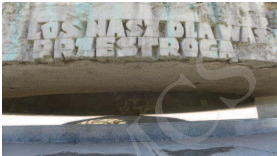
Ilustracja 6. Pomnik Walki i Męczeństwa Narodu Polskiego i Innych Narodów – Droga Hołdu i Pamięci – Mauzoleum (fragment), były niemiecki obóz koncentracyjny na Majdanku w Lublinie, fot. R. Gozdecka (2015).

Ku czci ofiar hitlerowskich obozów zagłady wzniesiono w 1984 roku pomnik-mauzoleum na Powązkach Wojskowych w Warszawie, według projektu Stanisława Soszyńskiego. Zostały w nim umieszczone urny z prochami pomordowanych w czternastu różnych obozach koncentracyjnych. Konstrukcja budowli ma kształt ramp kolejowych, pomiędzy którymi umieszczono ślady butów, rampy zaś prowadzą do krzyża i tablicy o kształcie pieca krematoryjnego. Na tablicy widnieje napis: „Prochy Polaków pomordowanych w hitlerowskich obozach koncentracyjnych wołają o pokój świata”.