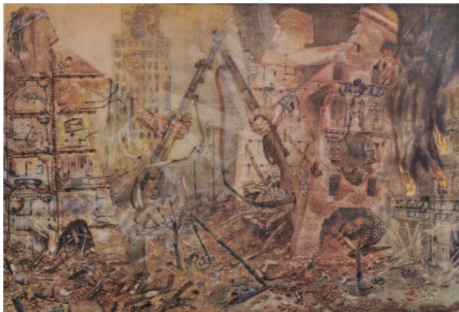
Ilustracja 3. Bronisław Wojciech Linke, Domy-żołnierze , 1947, z cyklu Kamienie krzyczą .

prace z cyklu Kamienie krzyczą 25 wystawiło Muzeum Narodowe w Warszawie już w 1948 roku, w tym m.in. obraz Domy-żołnierze – gdzie „domy rozdarte bombami otworzyły swoje wnętrza, ekshibicjonistycznie ukazując nie tylko dramat, ukazały rzeczy dotąd ukryte” 26 . Kompletny cykl powstający przez dziesięć lat (1946-1956) tworzy czternaście obrazów, spośród których w szczególny sposób uderzają swoją wymową Getto niezłomne , Egzekucja na ruinach Getta , El mole rachmim , Domy-żołnierze oraz Misterium 27 . Porażająca wizja ruin stolicy ukazana została przez Linkego w specyficznych kształtach kamienic uformowanych na kształt ludzkich postaci, o wręcz monstrualnych rozmiarach, pozbawionych realizmu.