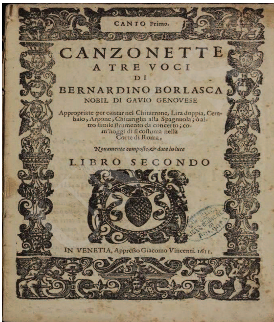
Ilustracja 4. Bernardino Borlasca, Canzonette , I-Bc, sygn. X. 140.