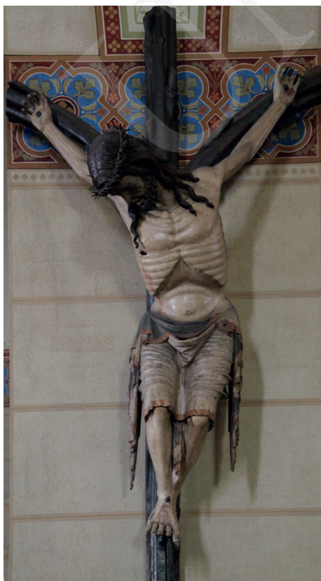
Ilustracja 10. Krucyfiks z kościoła Dominikanów w Friesach.