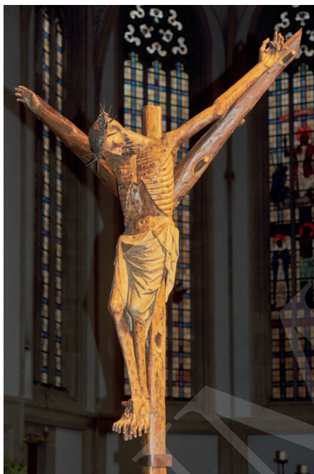
Ilustracja 17. Krucyfiks z kościoła św. Jerzego w Bocholt.