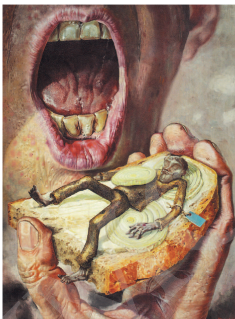
Ilustracja 2. B. W. Linke, Kanibalizm , 1950-1951, olej na płótnie, 100cm x 74cm.