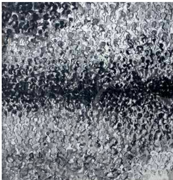
Ilustracja 2. J. Szajna, Mrowisko