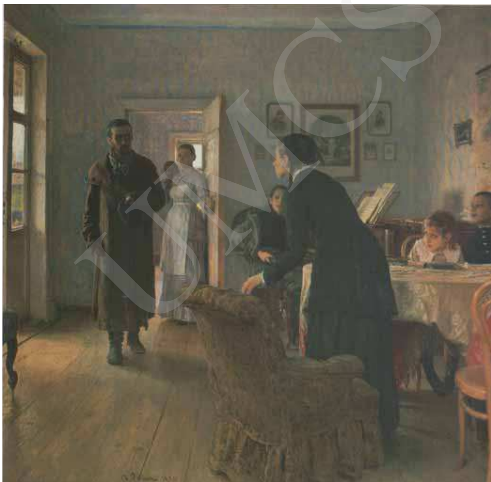
Ilustracja 1. Ilja Riepin, Nie zdali , 1884-1888, olej na płótnie, 160,5cm x 167,5cm.